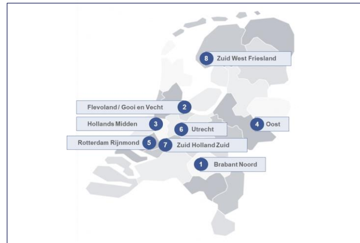
Figuur 2: Spreiding van de ingediende voorstellen

De betrokkenheid vanuit het veld is groot: de pilotvoorstellen vertegenwoordigen de plannen van ~100 zorgaanbieders vanuit verschillende domeinen (zie figuur 3).