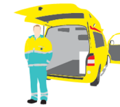
Derde ambulance bij grootschalige inzet