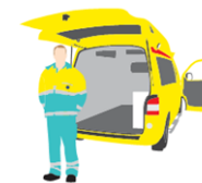
Eerste ambulance ter plaatse