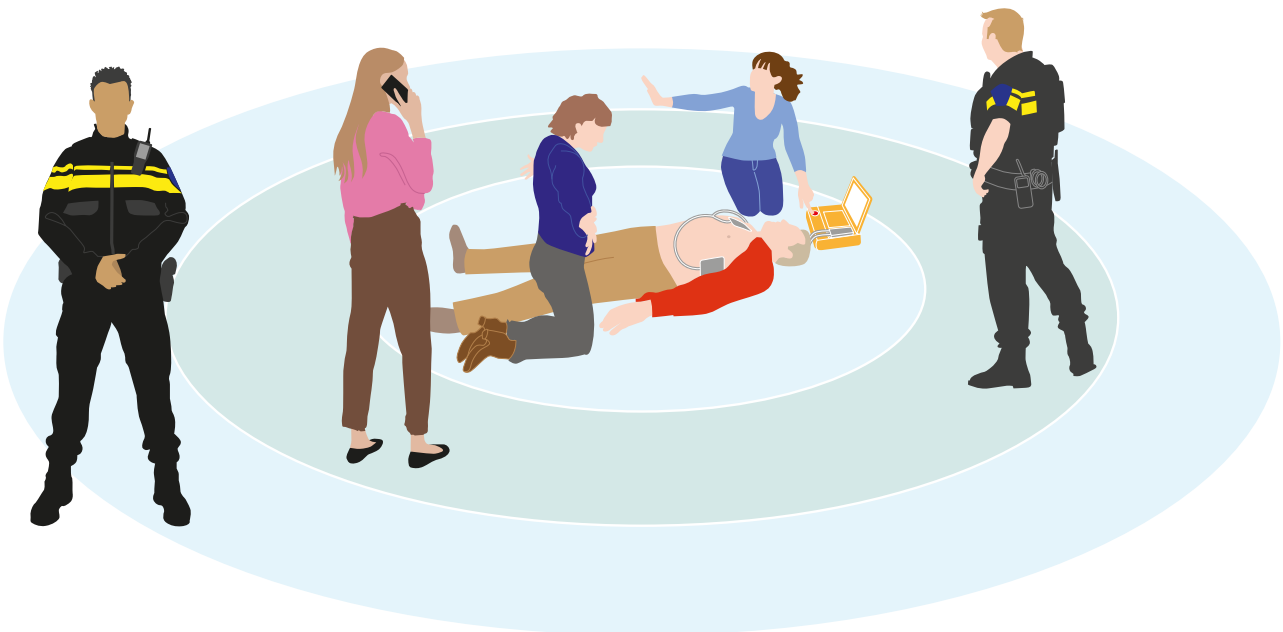
Figuur 3: Werkveld reanimatie met cirkels

(Meer informatie: De choreografie van de reanimatie - Human Factors & Teamwork. NRR, 2022 )